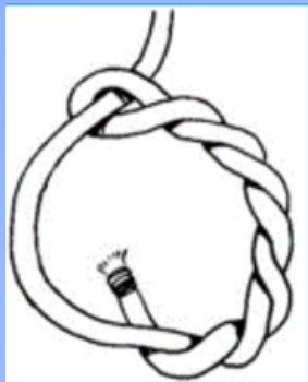
Timmermanssteek (beginknoop van een sjorring)